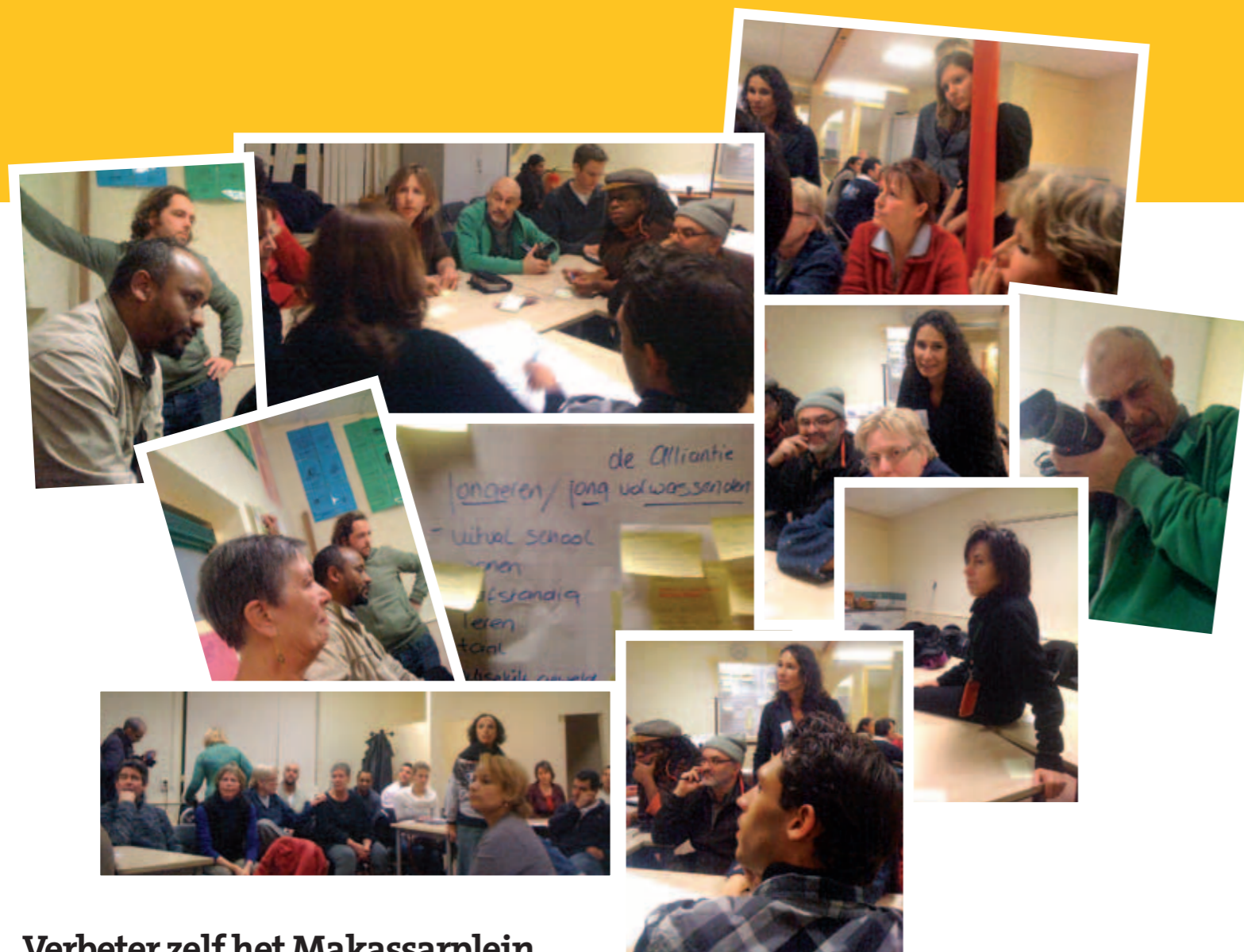
Op 1 december 2010 kwamen buurtbewoners en medewerkers van organisaties samen in Rumah Kami op het Makassarplein. Ze leerden elkaar kennen en maakten plannen voor de buurt.