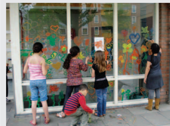
Kinderen uit de buurt fleuren de portiek naast het parkje op.