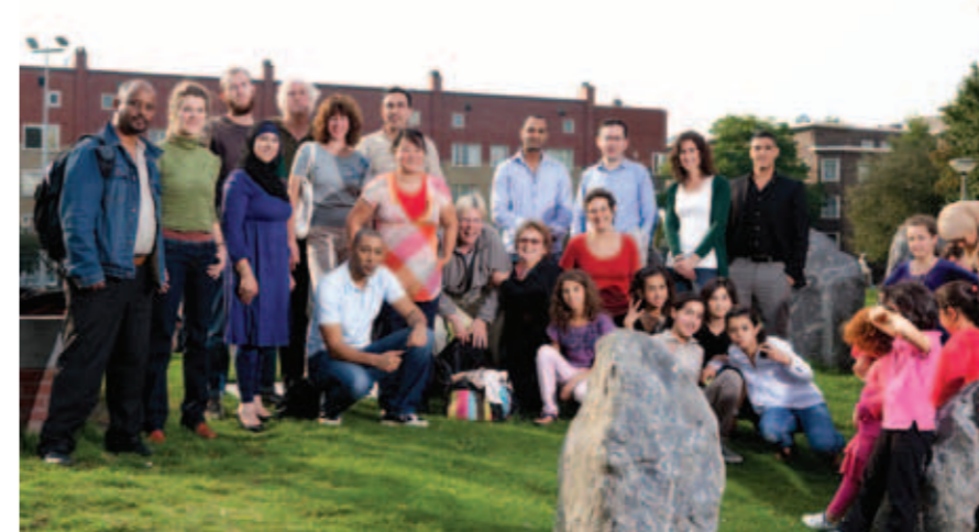
Buurtbewoners en medewerkers van organisaties hebben zich verenigd in de Makassarplein Community.

Aan dit nummer werkte mee Elhoussaine Hmimou, Khadija El Majdoubi, Mellouki Cadat, Mustapha Nahari Redactie Intse Hamstra, Rob van Veelen Tekst en eindredactie Marieke Mittelmeijer Ontwerpen en opmaak www.co3.org Oplage 5000 Fotografie 5,6 fotografie, StreetsmArt, Marieke Mittelmeijer, Mellouki Cadat, Irene Janze.