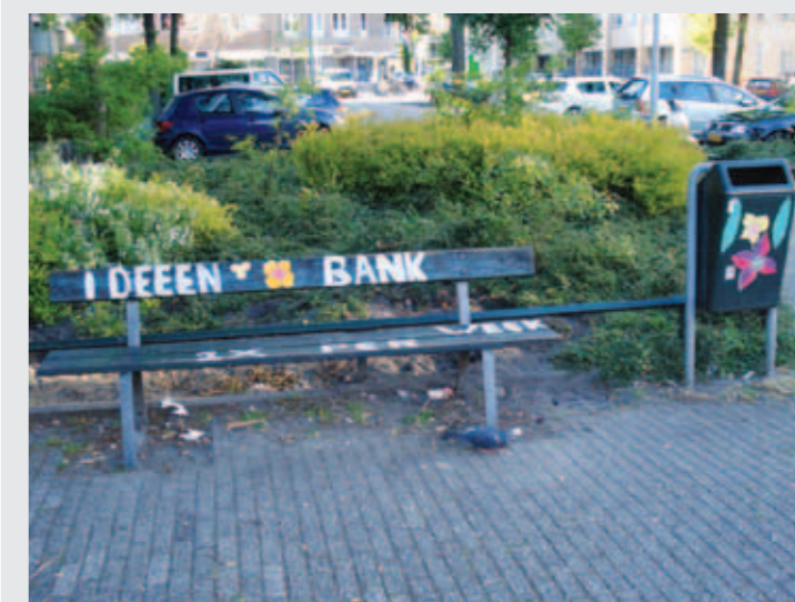
Op het ideeënbankje ontstond het idee voor een parkje.

Buurtbewoners gaan een postzegelparkje (klein parkje of pleintje waar je elkaar kunt ontmoeten) maken van het pleintje op de hoek Soembawastraat/Niasstraat. Het afgelopen jaar waren ze er al veel te vinden. Ze ontmoetten elkaar op de ideeënbank, waar het idee voor een parkje ontstond. Het ontwerp voor het parkje is nu in de maak.